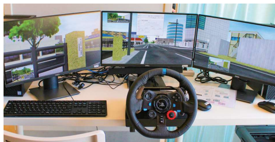
■ドライビングシミュレーター ハンドル・アクセル・ブレーキの操作だけでなく注意力や判断力など運転に必要な要素を総合的に評価します。

事前に眼科で検査をして頂いていない場合は最終判断前に視力、視野が安全運転を行う上で問題ないか眼科で検査を行って頂きます。